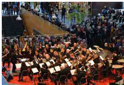
Nantes, La Folle Journée, février 2019