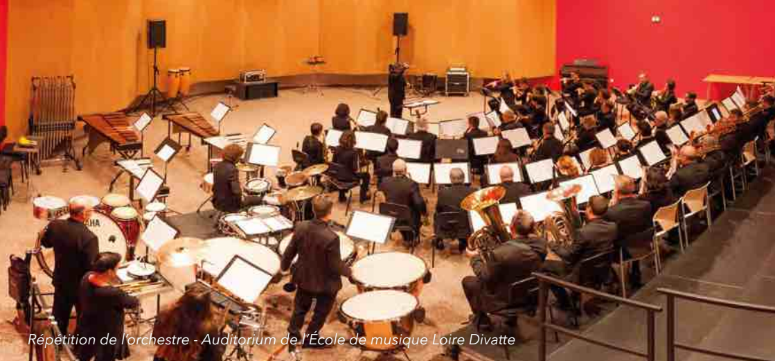
Répétition de l'orchestre - Auditorium de l'École de musique Loire Divatte