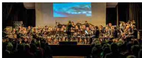
« La parade des animaux », novembre 2017