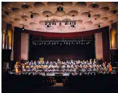
Cancelli Musique et Nantes Philharmonie, « Ballets russes », novembre 2016

Depuis plus de dix ans, l'orchestre d'harmonie de Saint-Julien-de-Concelles, Cancelli Musique, est régulièrement présent dans des festivals à l'échelle régionale (Folle Journée de Nantes depuis 2011, Jazz Tempo en 2011, La Rose des Vents en 2014, le Printemps des Jardins en 2016). Il reste également fortement investi dans la vie locale par le biais de nombreux projets en partenariat avec la municipalité et les associations (médiathèque, école de musique Loire Divatte, associations musicales, écoles primaires, collège).